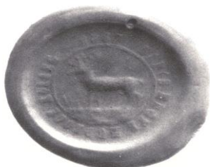
Pečať z roku 1867

na pečati s kruhopisom SÁROS MEGYE MUDRÓCZ KOZSÉG 1867 (Šarišská župa obec Mudrovce 1867) je vyobrazený na pôde stojaci jeleň